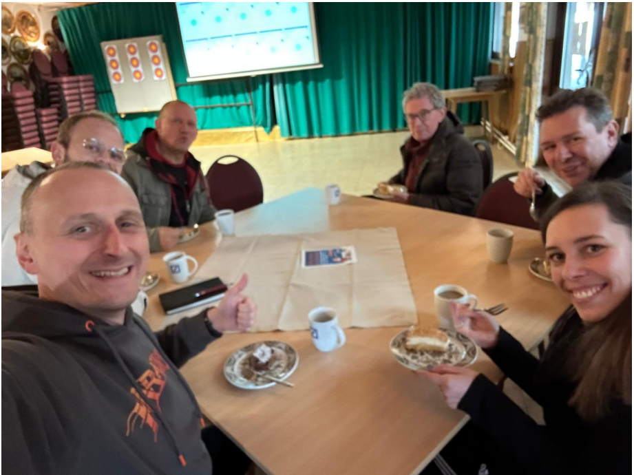
Text und Fotos: Stephan Stathel